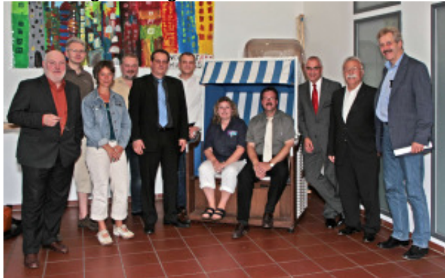
Die Mitglieder von links nach rechts:

Am 24. Juni 2009 wurde der Stiftungsrat neu gewählt, der am selben Tag den alten Vorstand einstimmig bestätigt hat.